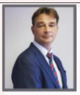
Grußwort des Schulleiters

Sehr geehrte Eltern, liebe Schülerinnen und Schüler, liebe Lehrkräfte und Angestellte der DSJ,